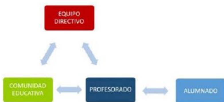
DIAGRAMA DE FLUJO DE INTERACCIÓN, COLABORACIÓN Y COMUNICACIÓN DE LA COMUNIDAD EDUCATIVA A TRAVÉS DE LA PLATAFORMA